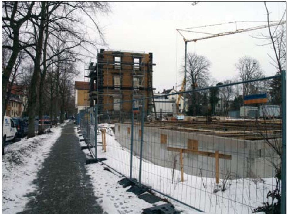
Der Gesamteindruck des Wallringgebietes wird wie hier am Petritorwall dauerhaft beeinträchtigt. Solche Sünden sollen in Zukunft verhindert werden.

Die SPD-Fraktion war von Anfang an für den originären Erhalt der Wallring-Bebauung im strengen Sinne der Wallringsatzung und unterstützte so die Proteste der Heimatpfleger.