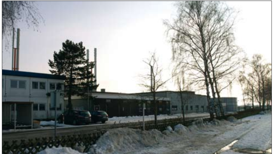
Auch in Zukunft ist kein Platz für Atommüll aus der Asse in Thune.

Als der Industriebetrieb beantragte, eine neue Halle zur Aufbereitung radioaktiver Abfälle in Thune zu errichten, wurde die Verwaltung hellhörig. Sie hatte den Verdacht, dass Eckert und Ziegler so die Aufarbeitung von Asse-Abfällen an diesem Standort vorbereiten wollte. Deshalb erließ der Oberbürgermeister in aller Eile eine Veränderungssperre und leitete die Aufstellung eines neuen Bebauungsplanes ein. Die SPD unterstützt diese Vorgehensweise. „Die Aufbereitung atomarer Abfälle aus Schacht Asse muss in Braun-